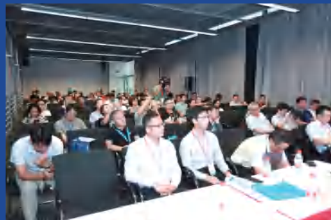
具体以现场公布为准