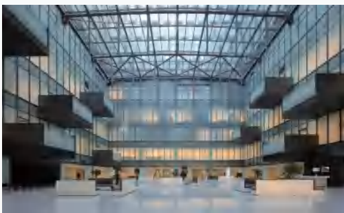
EXHIBIT PROFILE 展览范围